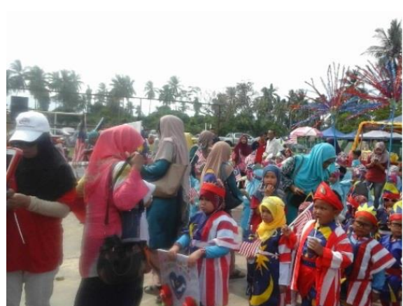
2.0 Peserta sedang mendengar taklimat advokasi klik dengan bijak.