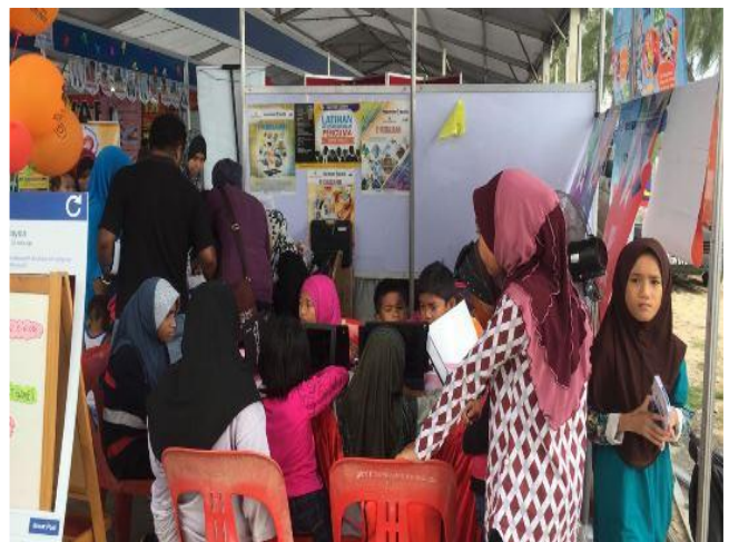
1.1 Peserta sedang mengikuti program e-pembelajaran di Pameran Pesta Pantai dari 18 – 25 September 2016