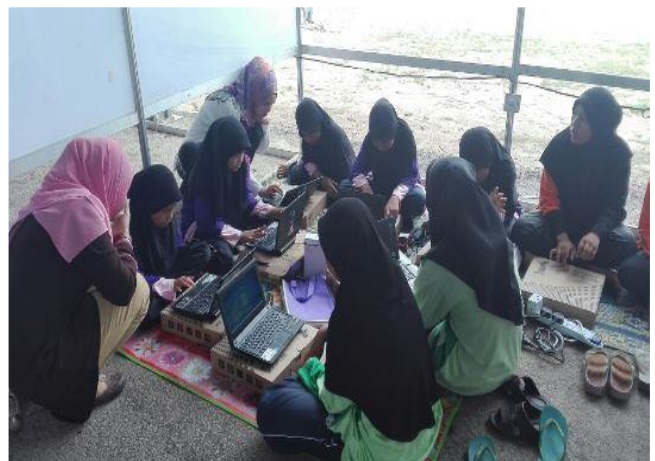
2.1 Peserta sedang mengikuti program Advokasi Klik Dengan Bijak di Pameran Pesta Pantai dari 18 – 25 September 2016